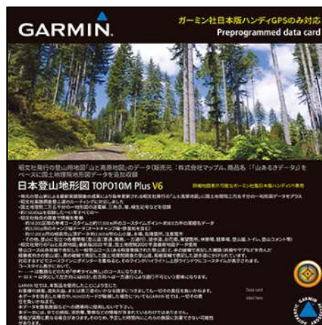
日本登山地形図 (TOP010M Plus V6) microSD 版

(注 4)日本登山地形図にはついては、当ホームページの「日本登山地形図の特徴」をご覧ください。